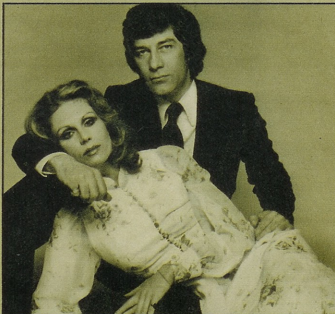
Joanna Lumley mit dem englischen Schauspieler Gareth Hunt. Er wird in den 30 neuen Folgen den Assistenten von John Steed spielen